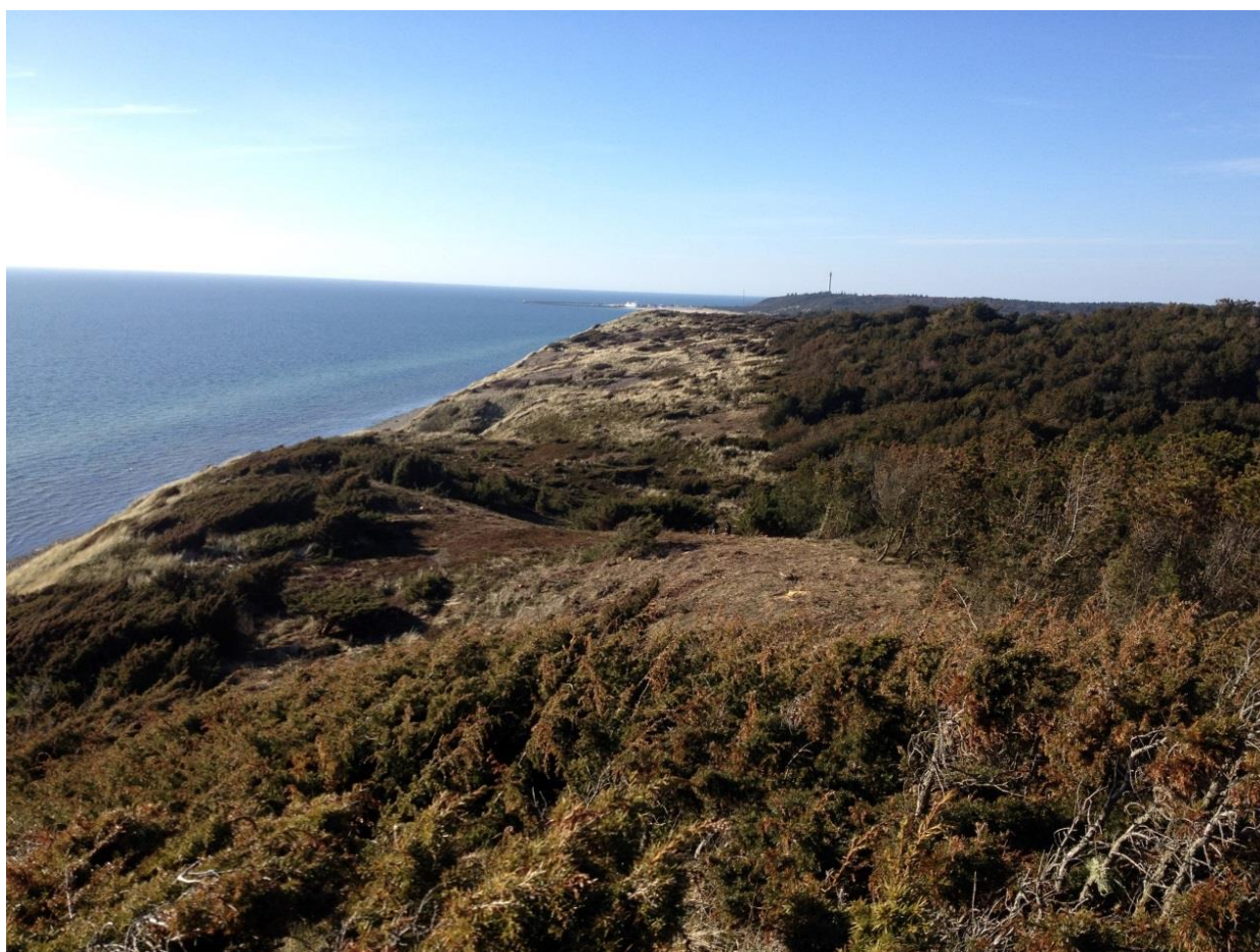
Sønderbjerg med udsigt over et nu lysåbent areal, der er ryddet for bjergfyr. Bevoksningen til højre viser, hvordan området så ud inden plejen.